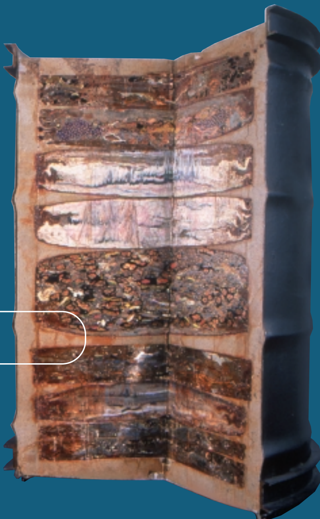
Le colis primaire

Seuls les déchets de faible activité et de courte durée de vie entrent en ligne de compte pour le dépôt en surface. Ces déchets comprennent toutes sortes de produits ou d'équipements, tels que des filtres usagés, des produits d'épuration, des gobelets, des vêtements ou encore des gants, qui sont entrés en contact avec des matières radioactives.